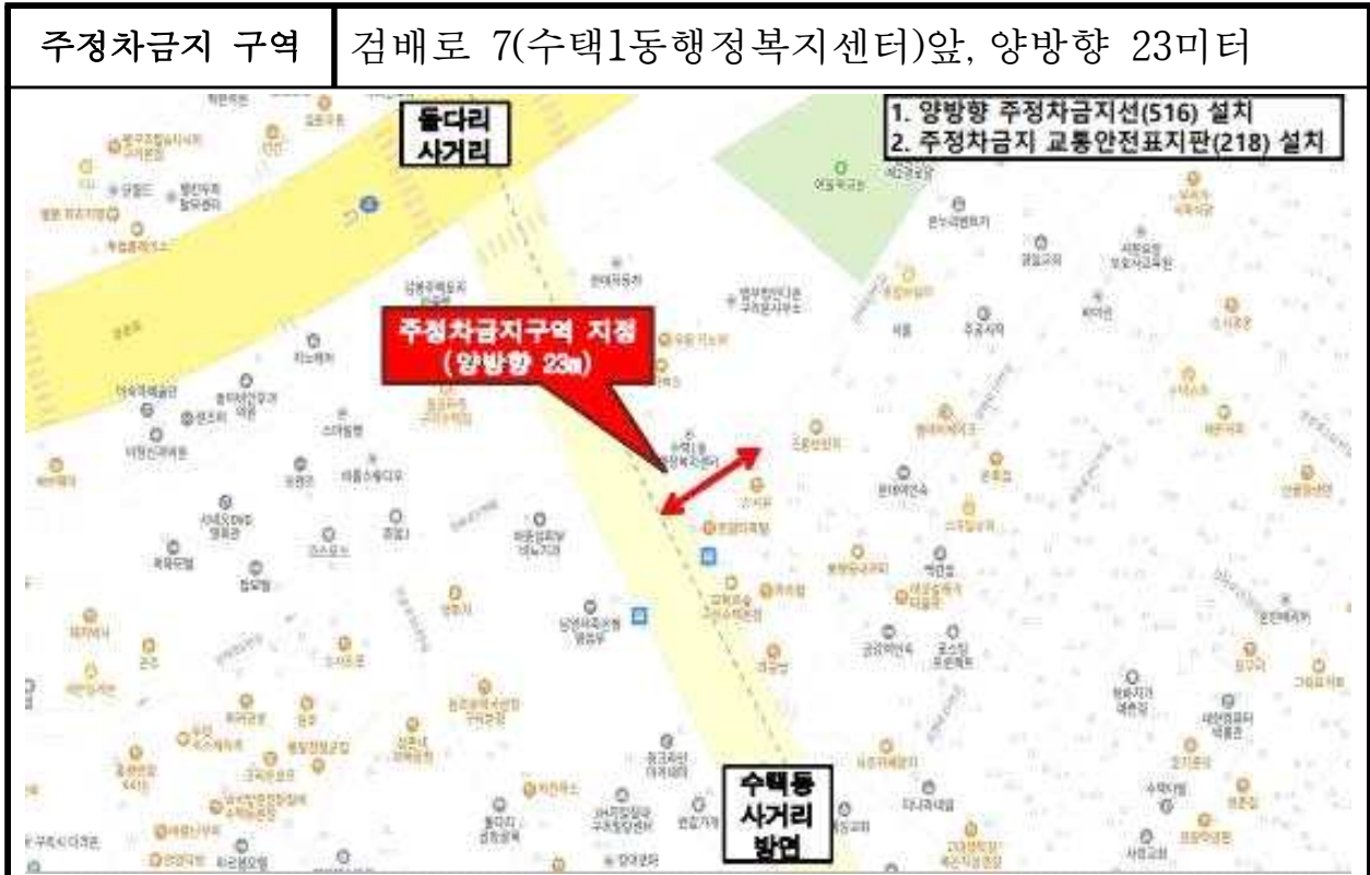
불법주정차 단속 세부 위치