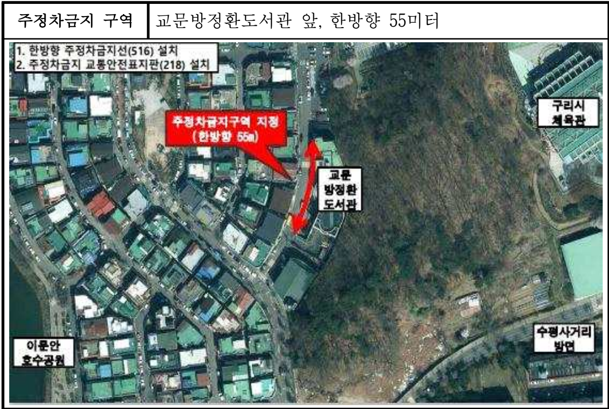
불법주정차 단속 세부 위치