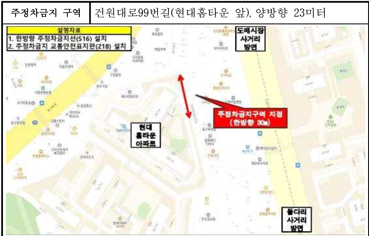
불법주정차 단속 세부 위치