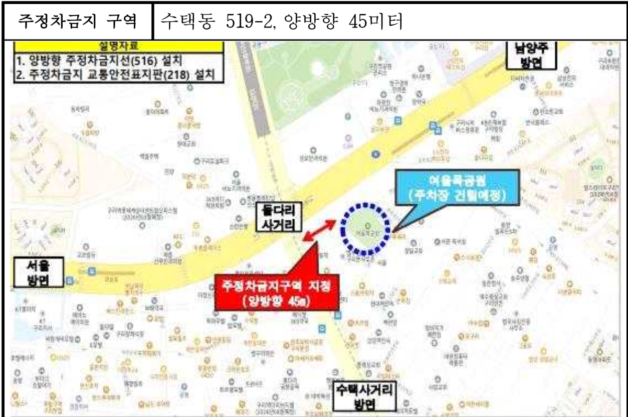
불법주정차 단속 세부 위치