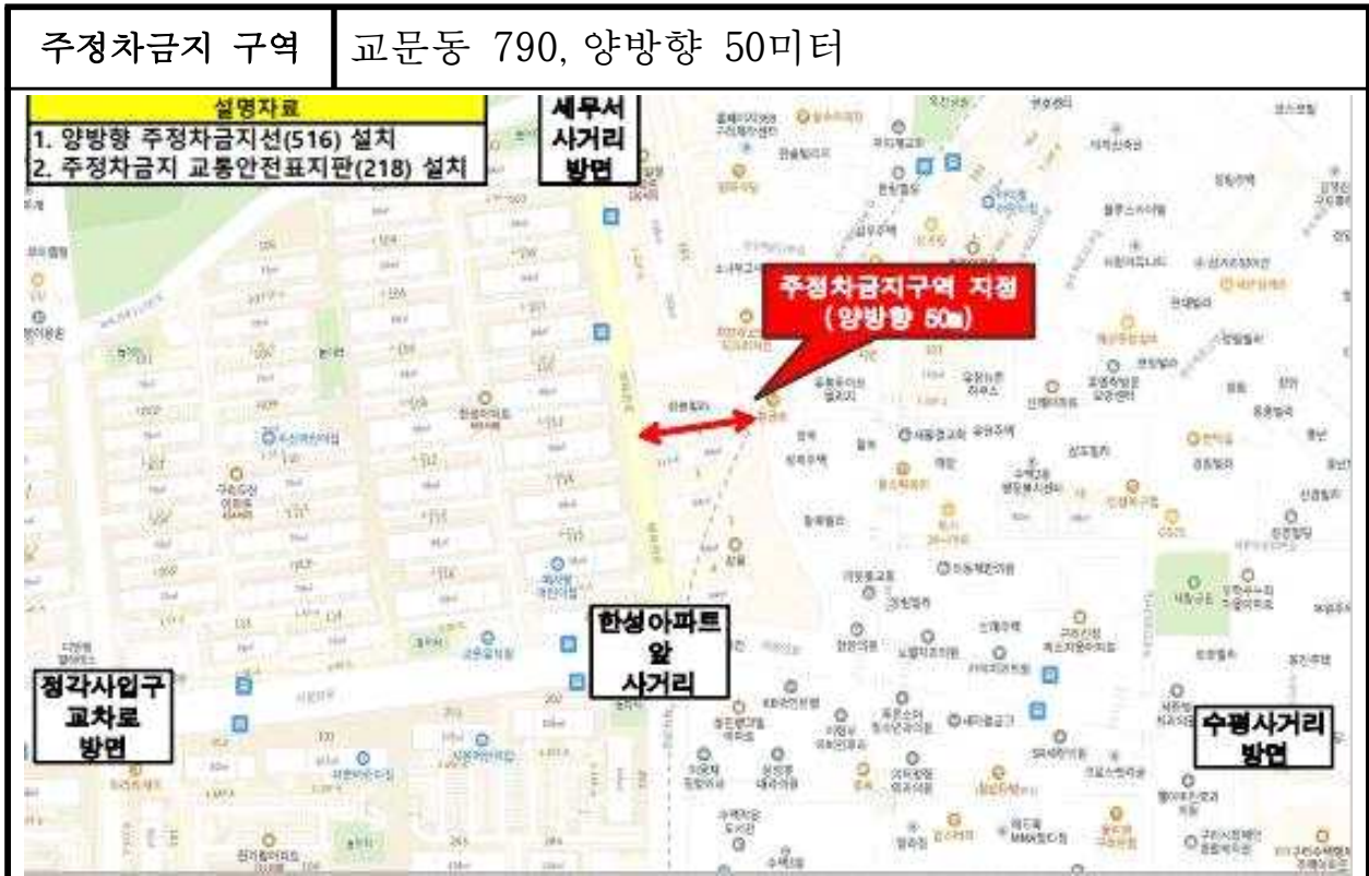
불법주정차 단속 세부 위치