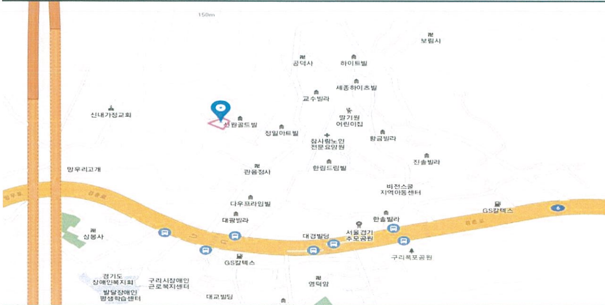
척 <임 의>